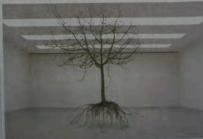
Holzskulptur «Natural Ready Made» von Com&Com.

Galerie Bernhard Bischoff, Bern: «Beauty Is the New Punk», bis 6. 3.