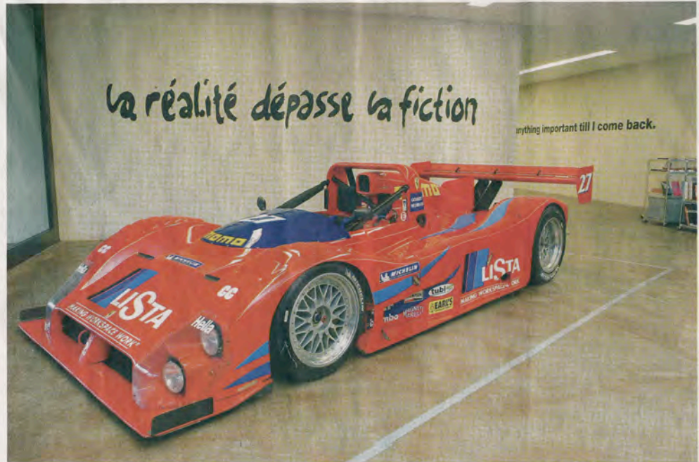
Blickfang: Der rote Weltmeister-Ferrari steht im Foyer des Pasquart.

Die bis zurück zu individuellen Arbeiten der beiden aus den 1990er-Jahren reichende Übersichtsausstellung im Kunsthaus Pasquart gibt indes nicht nur Gelegenheit, Fragmentarisches mit Gewinn in einen Gesamtkontext zu stellen. Sie markiert auch eine überraschende Zäsur, die bereits 2005 mit dem US-Road-Movie «The big one» das Ende der «Spass-Gesellschaft» einläutet, in dem Ende 2008 formulierten und 2009 als Multicolor-Airbrush-Arbeit veröffentlichten «1. Manifest» nun aber einen theoretischen Hintergrund erhält. Darin ist vom Beginn des post-ironischen «Com&Com»-Zeitalters die Rede, von Schönheit, von Wahrheit, die