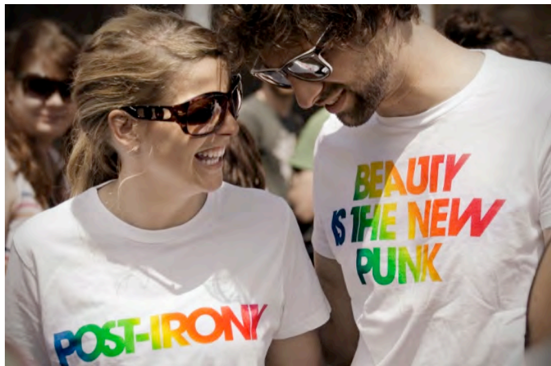
1) Ender (2010), 2) Google Earth Art (2008), 3) Baum (2010), 4) First Postironic Manifesto (2008), 5) T-Shirt Edition Postirony und Beauty ist he new Punk (2009)

«first post-ironic manifesto» by Com&Com (Marcus Gross) / Johannes M. Hiedinger 2008 www.postirony.com